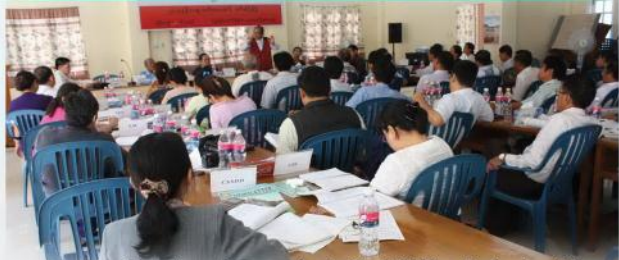
ပျာကညီဘျာထံခဝရရှာန် ပာဆုာတၢ်ကမံးတံၢ်တၢ်အိဉ်ဖျိဉ် ဘၣ်တၢ်မၤပံးဘၣ်အံၤ ဂုၤဂုၤဘၣ်ဘၣ် ပဲ ၂၀၁၄န့ဉ် လိဒ်ၤအိဉ်ဘၣ် (၁၉-၂၀)သီ ဖဲခဝရရှာန်န့ၣ်တက့ၢ်လၢ တၢ်စံးဘျူး တၢ်သ့ၣ်ထီဉ်ယံၢ်ကထာန့ၣ်လီၤ.