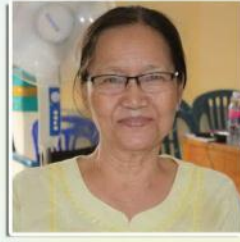
သရၣ်မုၢ်ဥလုၣ် (န့ၣ်ရွဲၣ်,တီၢ်တီအူကဲၤခၢၣ်ကဲၤဘါ)

ခဝုရၢၣ်ဖိလံၤသ့ၣ်စၢ, ပအိၣ်တုၢ်ဒီးတၢ် စံးဘျူးဖးဒိၣ်ဖိ ၂၀၁၃န့ၣ်ကတီၢ် ဝံၤ ပဆာဂုၤဘၣ် ခဝုရၢၣ်ဖိလံၤကိးဂါလာ ပကလံၤကဒီးဆူညါလာ တၢ်ဂံၢ်ဆူၣ်လီၤ။ ဟ့ၣ်ဆူၣ်သဆၣ်ထီၣ် ခဝုရၢၣ်ဖိလံၤ ကိးဂါလာ ပကလံၤဆူညါလာ တၢ်အိၣ်, တၢ်ယု တၢ်ဖိးပုၤတက့ၢ်။ ပကဘသဟံတုၢ်န့ၢ်ပုၤလာခံ တစါအယံလီၤ။