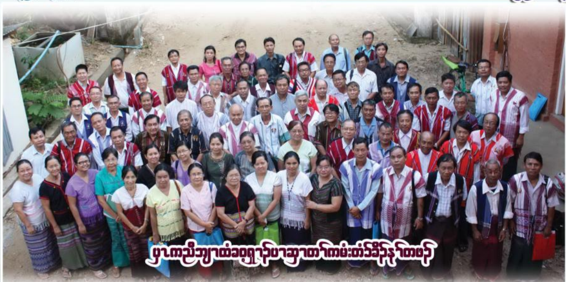
ပုၤကညီဘျုထံခဝုရၢၣ်ပာဆာတၢ်ကမံးတံၣ်ခၢၣ်စး