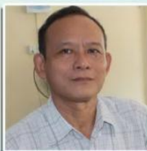
သရၣ်မုၢ်တုၣ်မုၢ်ဖျဉ် ပုၤန့ၣ်တၢ် ထူးထီၣ်ရုၤလီၤလဲၣ်လဲၣ်ဝဲၤကျိၤ

မိသုအိၣ်ဆူၣ်, မၤန့ၣ်အိၣ်ကဲ, ပုၤဒုၣ်ပုၤဒါကိးဂၢၤ တက့ၢ်. အိၣ်ဒီးကဲထဲတၢ်အမဲၢ်တဂ့ၢ်, အိၣ်ဒီးကဲ တၢ်အခိၣ်တက့ၢ်. တၢ်ဆိၣ်အိၣ်, ဆိၣ်ဘး ဆိၣ်ဘာ, ခဲလၢကဲဒုးကဲထီၣ်အိၣ်ဆူၣ် ဟီၣ်ခိၣ်ညၣ်ထုၣ်လၢ ဒုးဖိ ထီၣ် သ့ၣ်ထီၣ်ပုၤအါအါတက့ၢ်. ပမံၤပပုၤအတၢ်ကတိၤဒိလၢ အိၣ်ဒီးယွၤအတၢ် ဆိၣ်ဂုၤ အလၢအပုၤမုၢ်“ တီအိၣ်တလၢကဲ ဘျဉ်အိၣ် တလၢ”, “ပယူပပုၤ”, ပမၤမုၢ်သုၣ်ခိၣ်ဆၢၣ်ကဲထီၣ် ပတံၤသကိး”. မူသကိးပဝဲဒီး မၤန့ၣ်သကိးတၢ်တက့ၢ်.