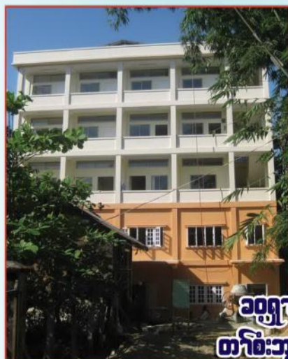
ခဝုရၢၣ်န့ၣ်(၁၀၀) တၢ်စံးဘျူးတၢ်သ့ၣ်ထီၣ်