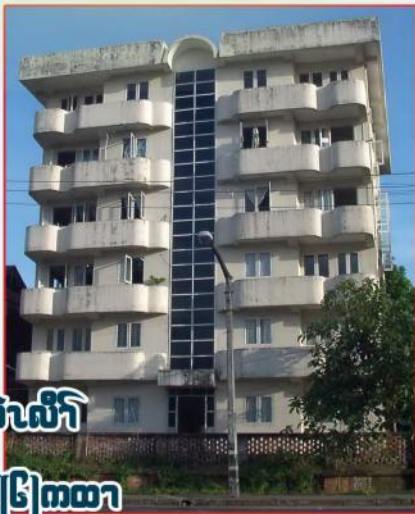
ခဝုရၢၣ်ဖိလံၤ တၢ်သ့ၣ်ထီၣ်(၆)ကထာ